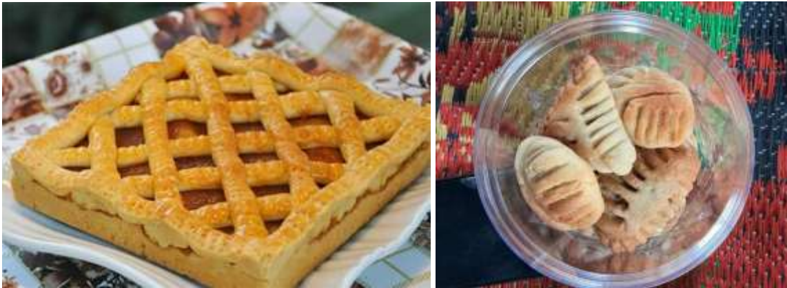
Gambar 2. Kuliner Tradisional Masyarakat Melayu Bengkulu yakni Baytat dan Anak Gandum