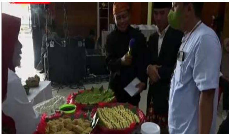
Gambar 6. Baytat sebagai kuliner khas yang dihidangkan pada acara-acara besar masyarakat Bengkulu

Seiring dengan perubahan zaman, terutama setelah akses terhadap bahan pangan menjadi lebih mudah, Baytat mulai mengalami pergeseran fungsi. Jika pada masa lalu bahan seperti tepung gandum dan mentega sulit diperoleh, maka pada masa sekarang bahan tersebut sudah tersedia secara luas (Rahman, 2013). Hal ini menyebabkan Baytat tidak lagi terbatas pada kalangan tertentu, tetapi dapat dibuat oleh masyarakat secara umum (Syaputra, 2024). Namun demikian, perubahan ini tidak sepenuhnya menghilangkan makna simbolik yang melekat pada Baytat. Hal ini ditegaskan oleh Rolly Gunawan (43 tahun) dari Komunitas Sejarah Bengkulu, yang menyatakan bahwa Baytat bukan sekadar makanan khas, tetapi merupakan jejak sejarah yang mencerminkan hubungan Bengkulu dengan dunia luar serta perkembangan budaya masyarakatnya. Ia menilai Baytat sebagai “arsip budaya” yang dapat dibaca melalui bahan, rasa, dan cara penyajiannya (Gunawan, 2026). Pandangan ini menunjukkan bahwa Baytat memiliki dimensi historis yang kuat, di mana makanan dapat berfungsi sebagai sumber untuk memahami masa lalu. Baytat tidak hanya mencerminkan perubahan dalam pola konsumsi, tetapi juga menunjukkan bagaimana masyarakat Bengkulu beradaptasi terhadap pengaruh luar dan mengolahnya menjadi bagian dari identitas mereka.