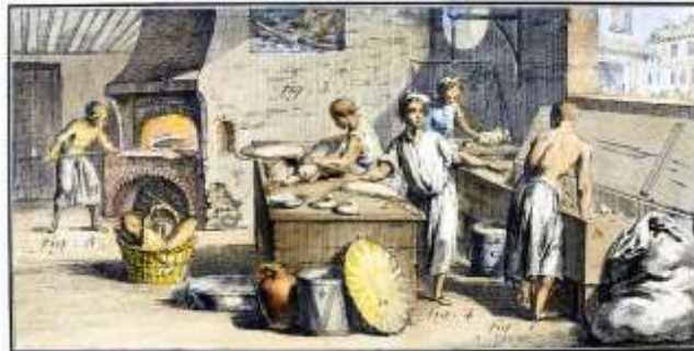
Gambar 5. Pembuatan Roti pada Abad ke-18 di Eropa