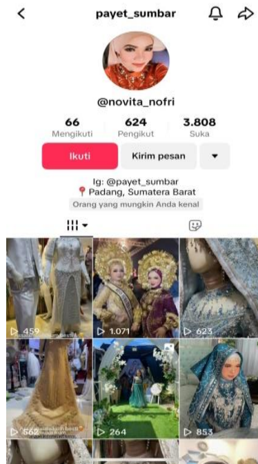
Gambar 4. Platfom media sosial Instagram dan TikTok usaha Payet Sumbar