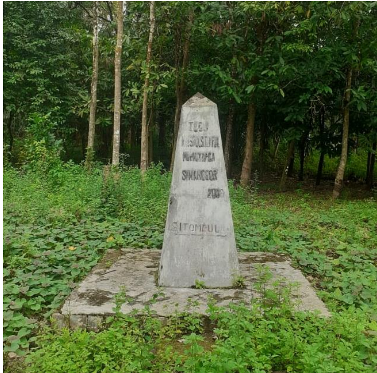
Gambar 1. Tugu Parpadanan Simanosor