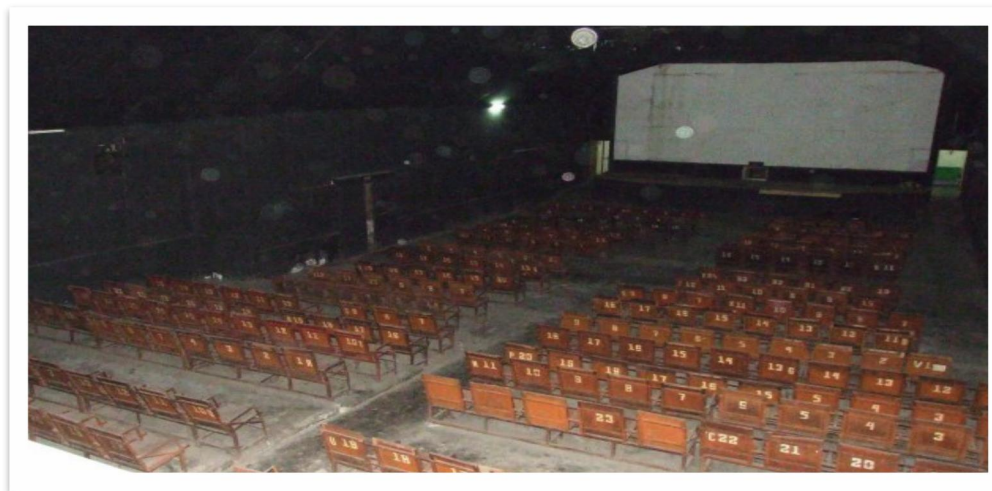
Sumber: Arsip Komunitas Gubuk Kopi Padang Panjang (Foto diambil pada April 2012)

Fasilitas lain yang dilakukan Bioskop Karia Solok 1970-an sudah menggunakan AC (Air Condition) guna menjaga suhu ruangan demi kenyamanan pengunjung yang akan menikmati film yang sudah tersedia, tempat duduk yang disediakan dalam bioskop memakai gabus membuat bangku atau kursi ini nyaman untuk diduduki oleh pengunjung. Di samping kebutuhan di atas, penonton juga menghendaki ketenangan dalam menikmati pemutaran film, ketenangan penonton ini dapat berupa jaminan keamanan bagi kendaraan milik penonton dan suasana lingkungan bioskop dijaga oleh beberapa TNI AD dan Kepolisian. Dalam menghadapi saingan dengan bioskop-bioskop yang berada di Kota Solok seperti Bioskop Purnama dan Bioskop Wirayudha, pimpinan berusaha melakukan promosi kepada calon penonton melalui: