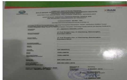
Sumber: Dokumentasi Peneliti Sertifikat PT Amia Insanillahia

Pada tahap awal didirikannya, pabrik PT. Amanah Insanillahia di Kabupaten Tanah Datar ini memproduksi beberapa jenis ukuran air mineral dalam kemasan.. Area distribusi PT Amia Insanillahia di Kabupaten Tanah Datar meliputi Provinsi Sumatera Barat. Karena keterbatasan area distribusi tersebut pabrik Amia baru memiliki dua line produksi yaitu untuk galon dan botol menengah,botol kecil. Sementara untuk kemasan gelas 200 ml dan botol 1,5 Liter masih didatangkan dari pabrik. Dari tahun ke tahun permintaan pasar untuk Air Mineral Dalam Kemasan (AMDK) merek Amia meningkat.