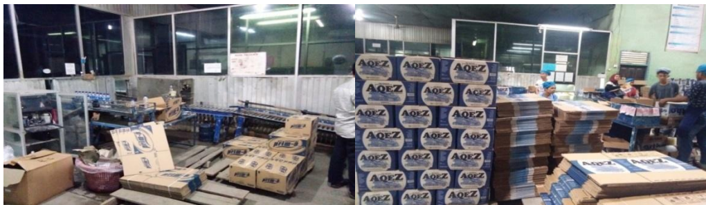
Sumber: Dokumentasi pribadi Peneliti Distributor Air Mineral dan Kemasan tahun 2020

PT Amanah Insanillahia, produsen air minuman dalam kemasan (AMDK) merek Aqez, unit produksi Sumatera Barat di Tanah Datar sebelum mampu berproduksi permintaan pasar secara total, PT Amanah Insanillahia baru mampu berproduksi maksimal 20 juta liter per bulan. Produksi pabrik Aqez di Tanah Datar masih dalam kondisi normal, belum ada pengembangan. Sementara permintaan produksi air minum dalam kemasan masih tinggi. Pada tahun 2018 lalu kapasitas produksi perusahaannya hanya menghasilkan 20 juta liter per bulan. Keterbatasan produksi air mineral tersebut terutama disebabkan