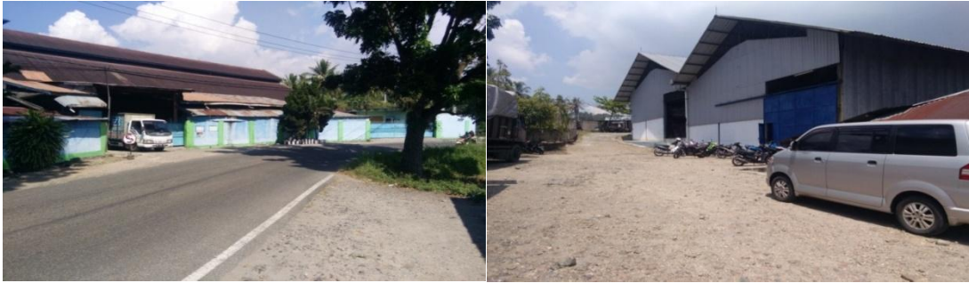
Sumber: Dokumentasi pribadi Peneliti Pintu Depan dan Pintu Belakang PT Amanah Insanillahia tahun 2020

Kehadiran Pabrik Amanah Insanillahia di wilayah Batusangkar Tanah Datar senantiasa memperhatikan faktor lingkungan dan sosial. Dimulai dari proses pemilihan sumber daya alam air kiambang yang seimbang melalui kriteria, Proses dan tahapan. Proses pengambilan air dari tanah dalam juga telah dipastikan melalui penelitian mendalam agar tidak berhubungan dengan air permukaan yang biasa digunakan masyarakat untuk memenuhi kebutuhan sehari-hari seperti irigasi dan sebagainya