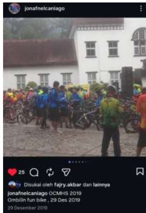
Gambar. 3 Arsip Postingan Instagram Informan 2019