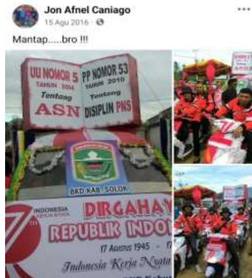
Gambar.1 Postingan pertama Informan awal mula menjadi citizen journalisme