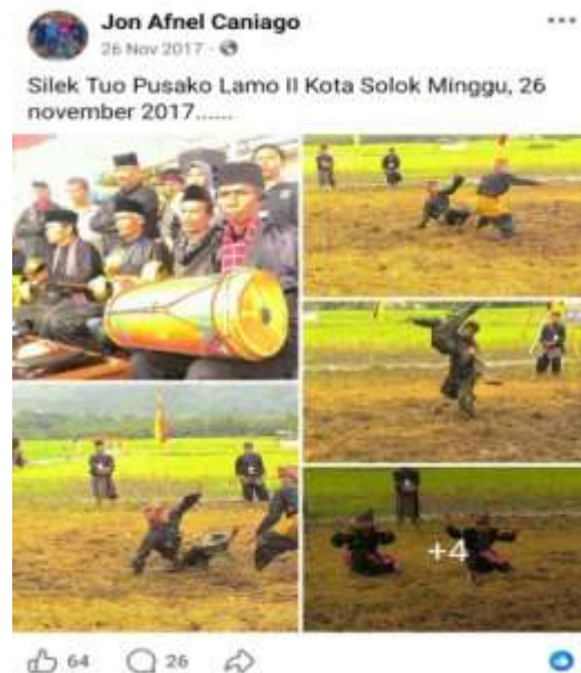
Gambar.2 salah satu bukti peningkatan sebagai citizen journalism