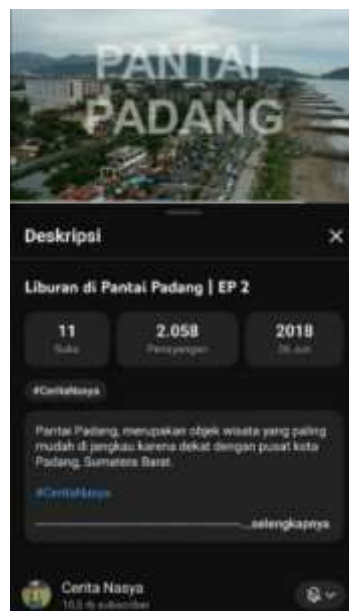
Gambar.6 Arsip Penggunaan Youtube oleh Jurnalis Profesional 2018