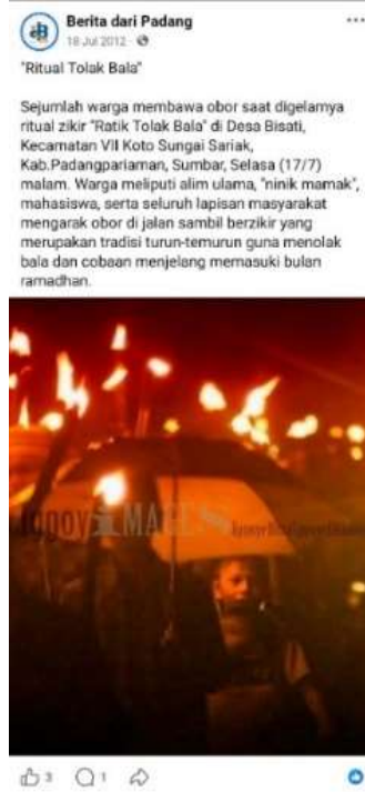
Gambar.5 Arsip Penggunaan Facebook oleh Jurnalis Profesional 2012